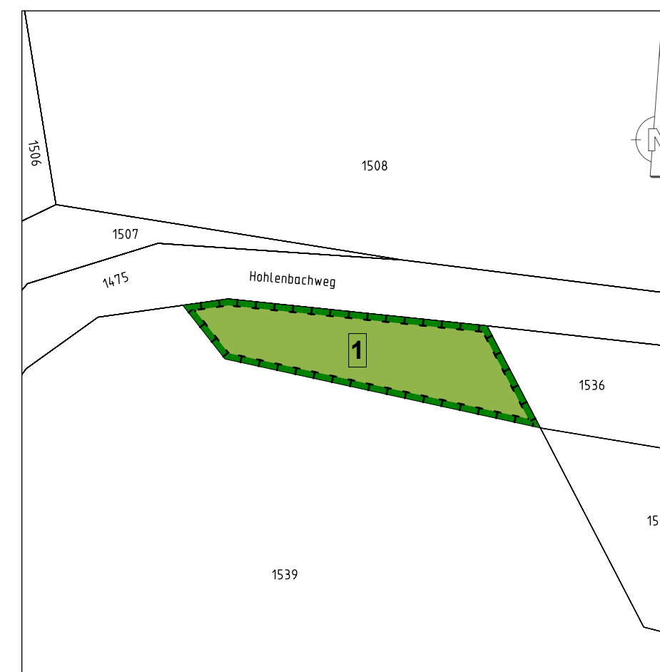
Übersichtslageplan Ausgleichsfläche 1 gem. Textteil Maßstab 1:750. Es bedeuten: 1. Maßnahme Feldgehölzhecke (ca. 450m 2 ), Teilfläche Flst. Nr. 1539

Für den gesamten Geltungsbereich: SO 0,6 a max 10° Z.B. III siehe Planeinschrieb mbH siehe Textteil