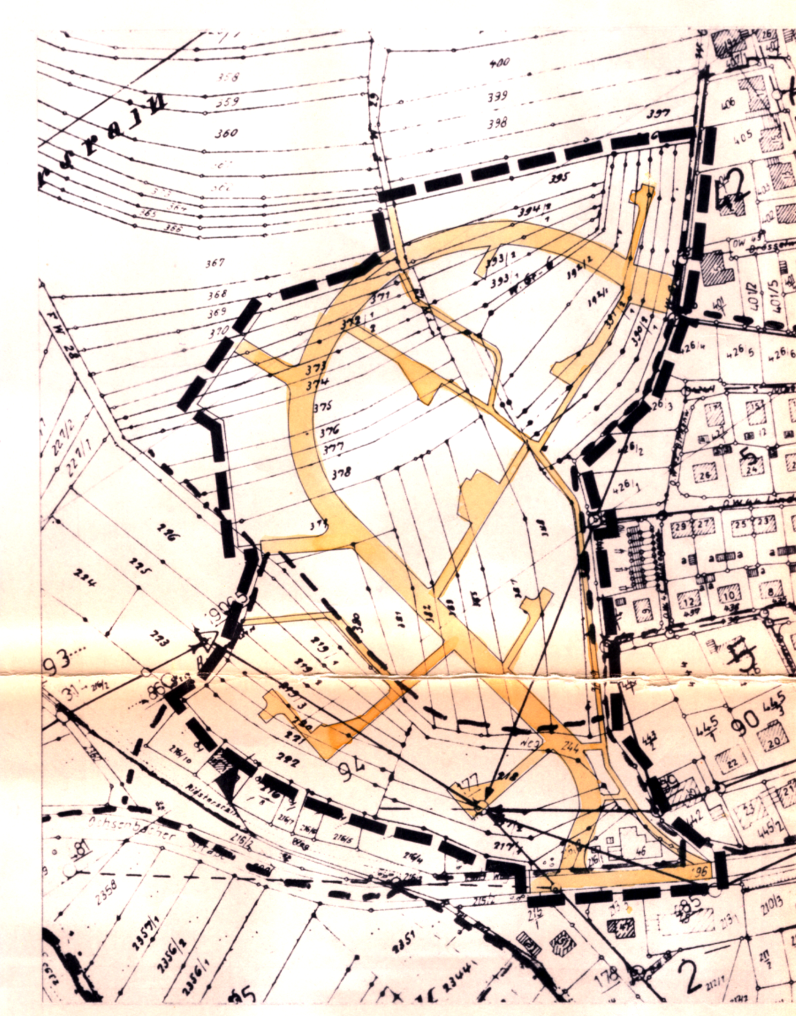
ÜBERSICHT M 1:2500